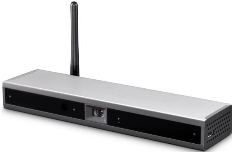
图 3-1 外观图

终端集主机、摄像机、麦克风、Wi-Fi 等多模块于一体，外观如图 3-1 所示。