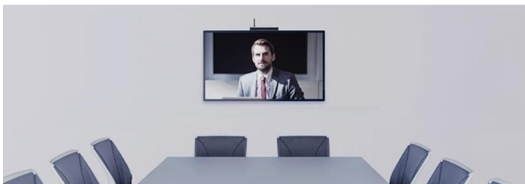
图 2-1 小型会议室场景

终端采用 H.264 HP SVC 柔性编解码，支持 1080P 高清双向视频通信能力，与高清电视机组合，形成最佳性价比会议室方案，如图 2-1 所示。