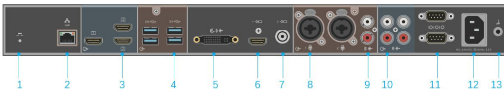
表 3-2 终端后面板标识说明