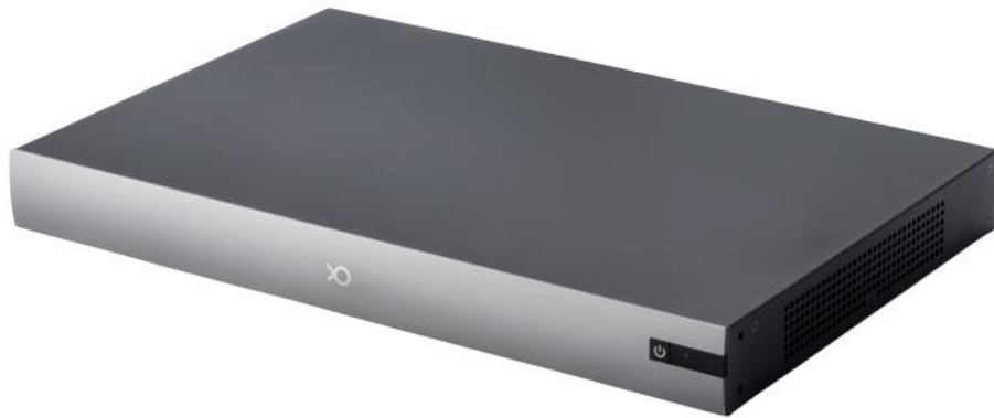
图 3-1 外观图