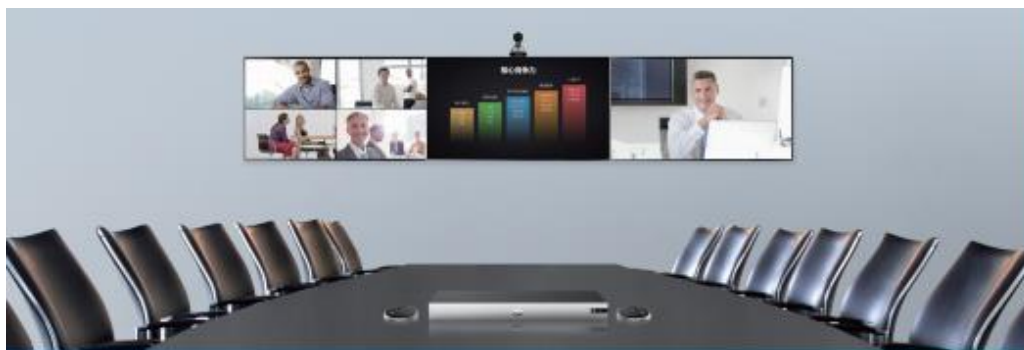
图 2-1 大型会议室场景

终端可连接电视屏幕或投影仪作为视频输出，具备丰富的音视频接口，满足大型会议室专业音视频设备的集成和部署，如图 2-1 所示。