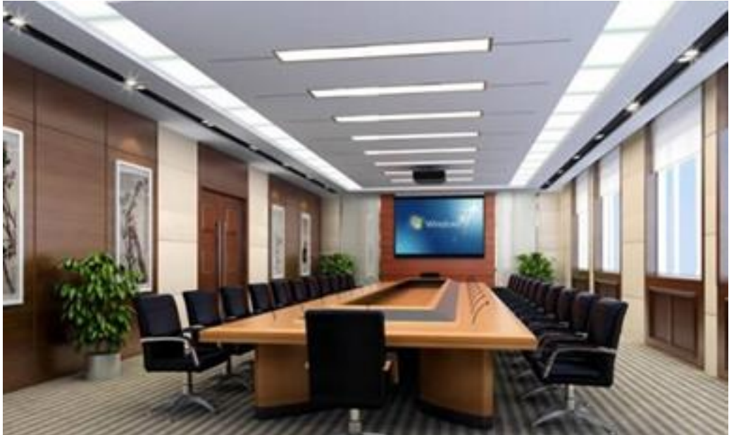
图 2-1 大中型会议室场景

终端支持通过 HDMI 视频输出接口连接单显示屏或双显示屏使用，采用多媒体总线技术，让会议室集成布线更简洁高效，如图 2-1 所示。