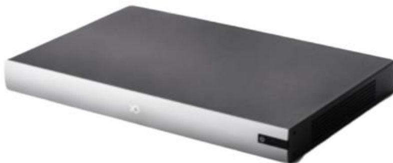
图 3-1 外观图