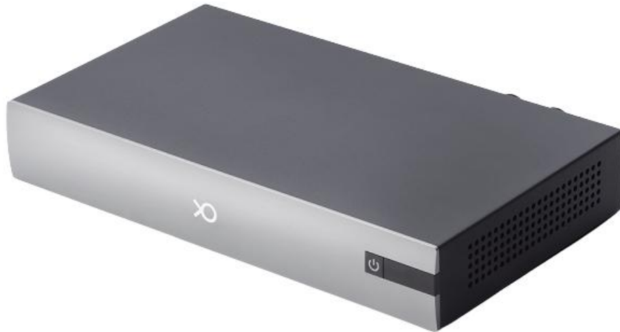
图 3-1 外观图