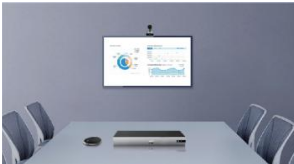
图 2-1 中小型会议室场景

终端标配 12 倍光学变焦的高清会议摄像机及全向麦克风，可连接电视屏幕或投影仪作为视频输出，适用于中小型会议室场景，如图 2-1 所示。