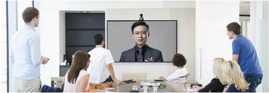
图 2-1 中型会议室场景

终端支持通过 HDMI 接口连接电视屏幕或投影仪作为视频输出，采用多媒体总线技术，让会议室集成布线更简洁高效，如图 2-1 所示。