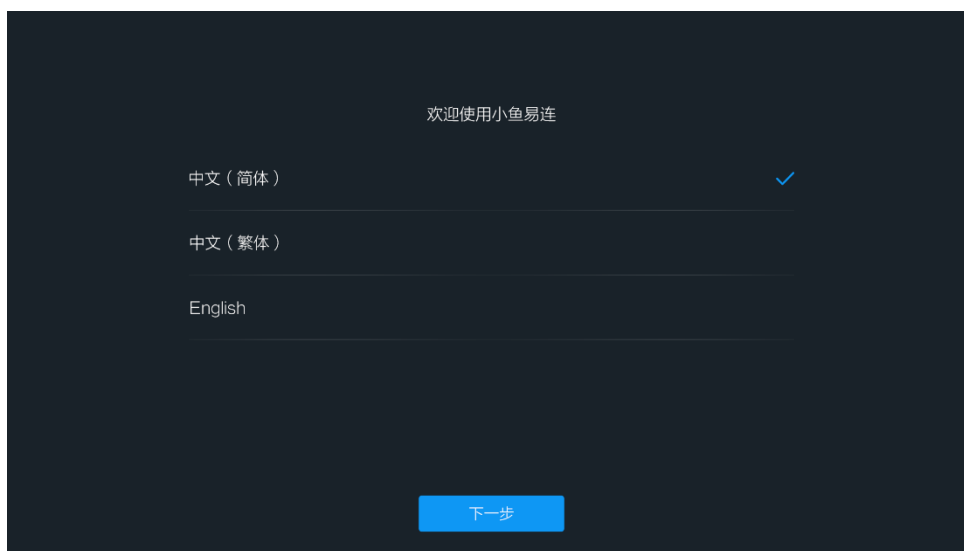
图 4-1 语言选择界面