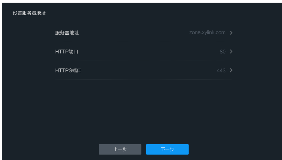
图 4-3 网络设置界面