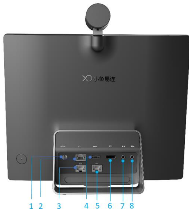
表 3-1 一体化智能终端接口连接说明