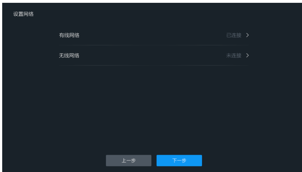
图 4-2 网络设置界面