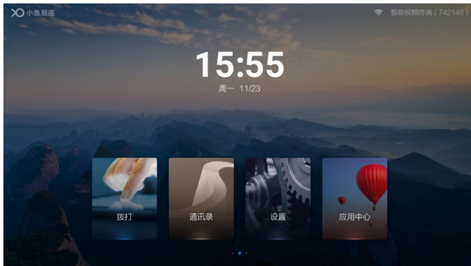
图 4-5 一体化智能终端主界面