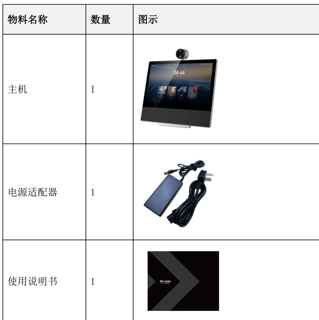
表 2-1 产品清单说明