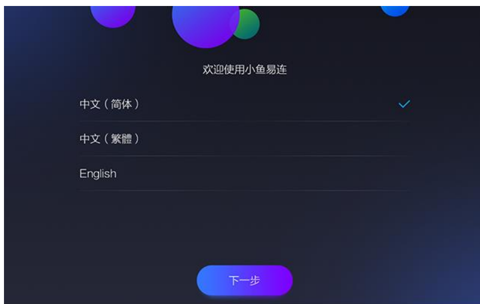
图 4-1 语言选择界面