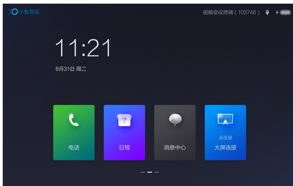
图 4-5 终端主界面