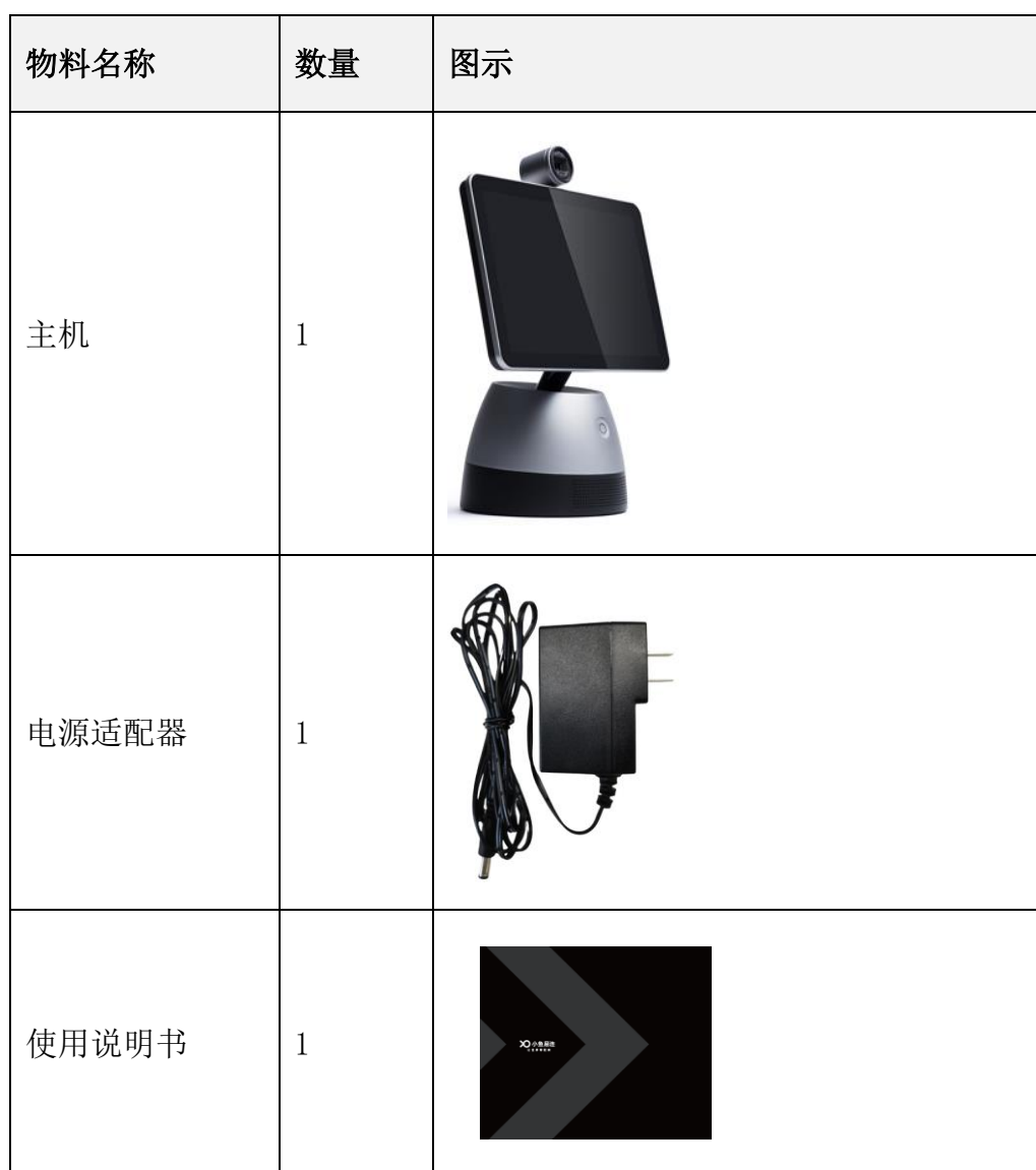
表 2-1 产品清单说明