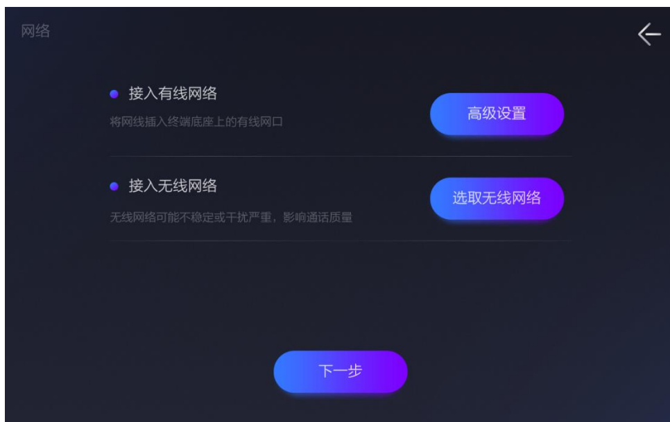
图 4-3 网络设置界面