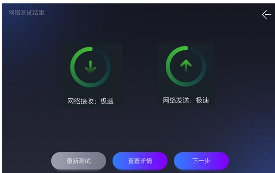
图 4-4 终端检测界面