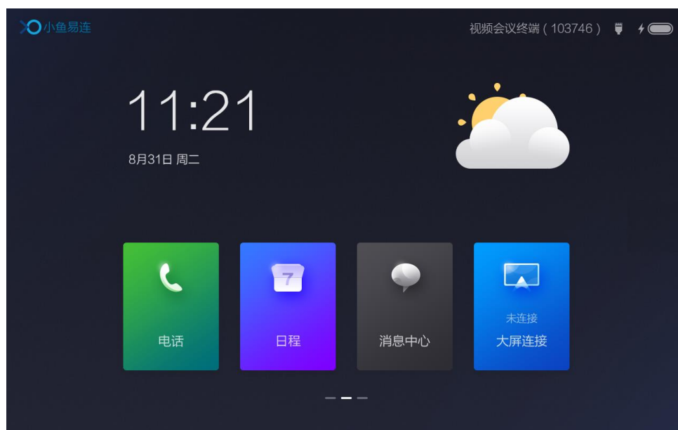
图 4-5 终端主界面