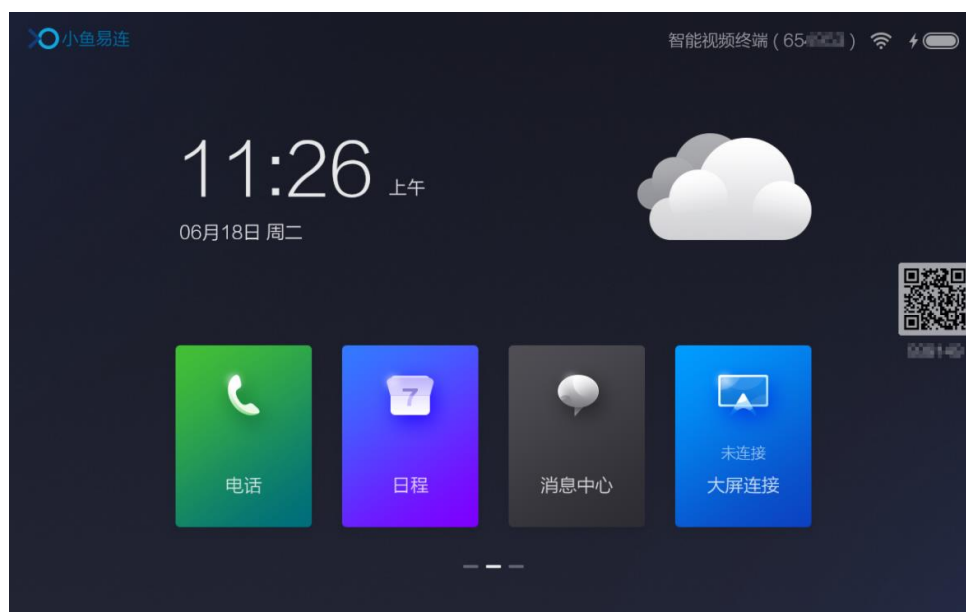
图 4-5 终端主界面